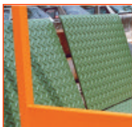
Puente de conexión