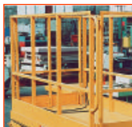
Barandilla de seguridad