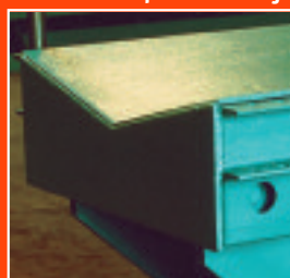
Plataforma en « V »