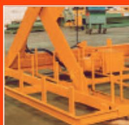
Refuerzo para cargas rodantes en posición baja