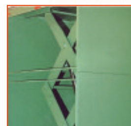
Faldones de protección rígidos