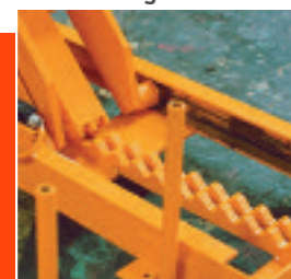
Cerrojo a cremallera