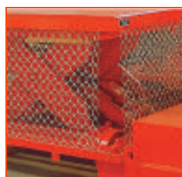
Protección de mallas metálicas