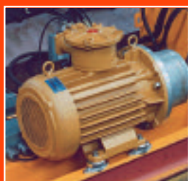
Protección ATEX antideflagrante