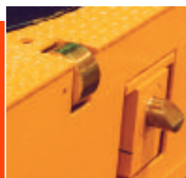
Cerrojo de seguridad